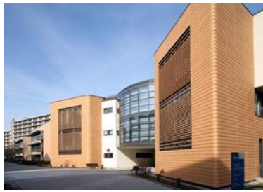
St. Georg (Hamburg)