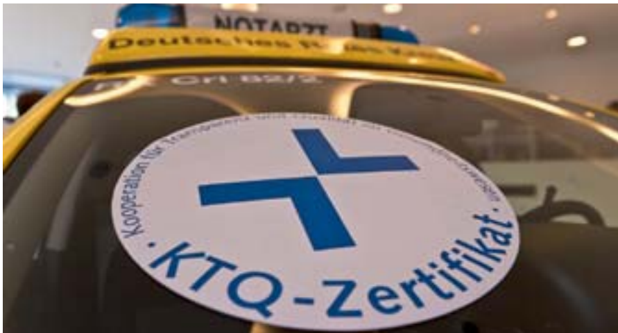
Das neue KTQ-Zertifikat „Rettungsdienst“ ist auch für Krankenhäuser von Vorteil.