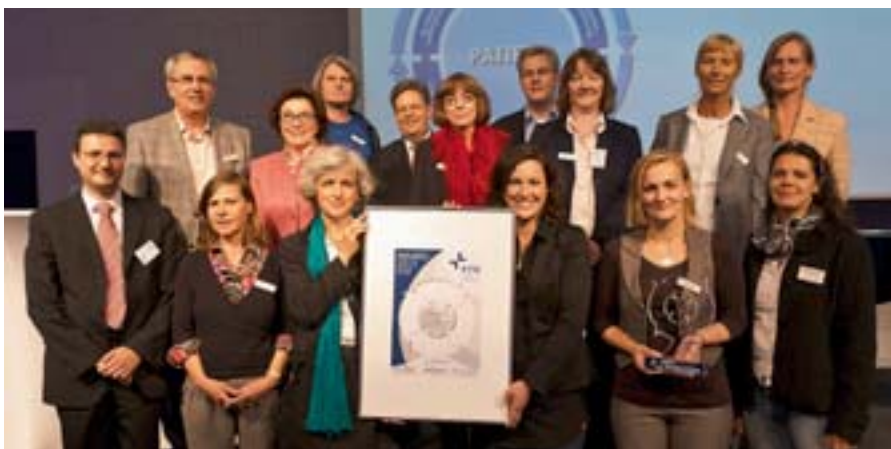
Der KTQ-AWARD 2011 wurde beim KTQ-Forum an die anwesenden Mitarbeiter des Gemeinschaftskrankenhauses Havelhöhe überreicht. Ausgezeichnet wurde das Krankenhaus für seine Organisationsentwicklung und Mitarbeiterführung mit dem Konzept der „Verantwortungskreise“.